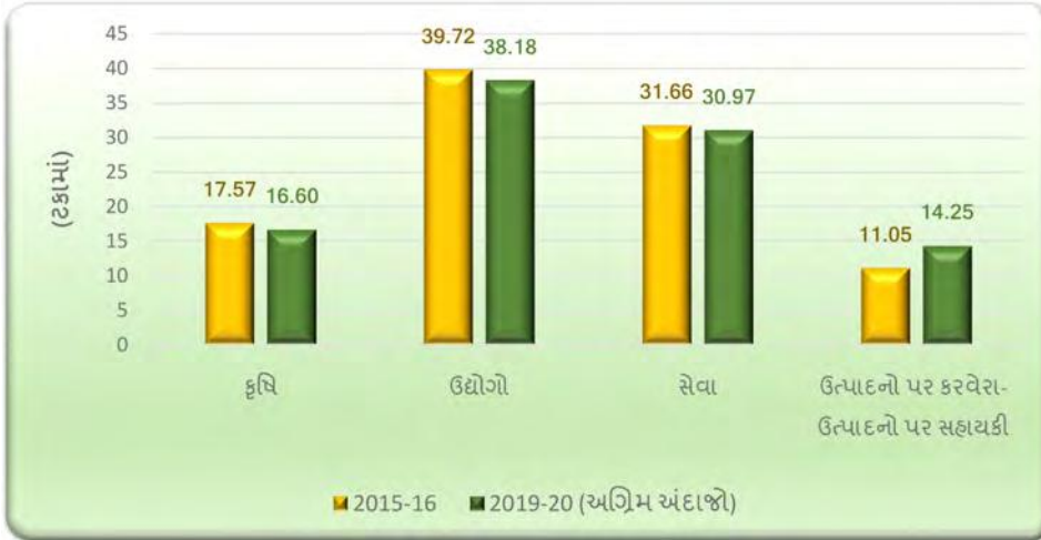
આલેખ 1.1: રાજ્યના એકંદર ધરેલુ ઉત્પાદનમાં ક્ષેત્રવાર ફાળામાં ફેરફાર (2015-16થી 2019-20)