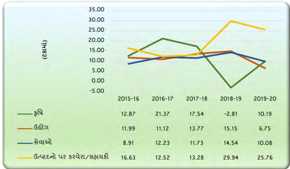
આલેખ 1.3: 2015-20 દરમિયાન ક્ષેત્રવાર વૃદ્ધિ દર