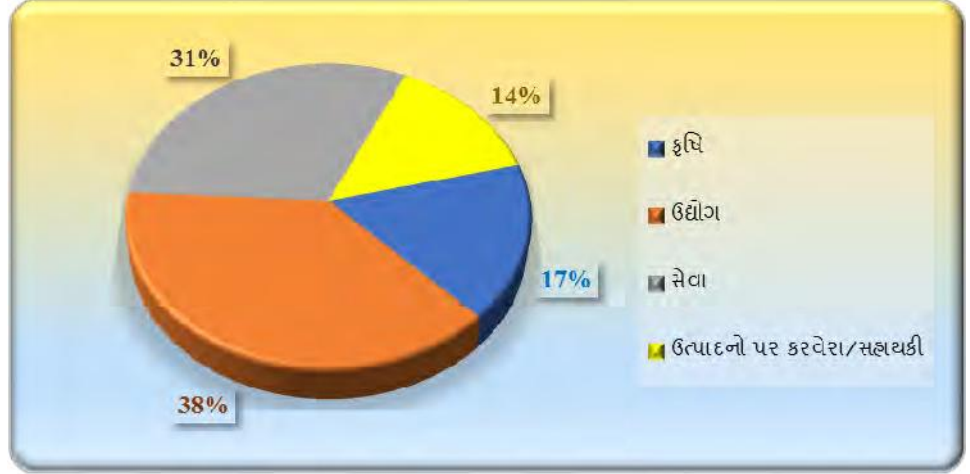
આલેખ 1.2: 2019-20 દરમિયાન GSDPની તુલનાએ ક્ષેત્રવાર ફાળો